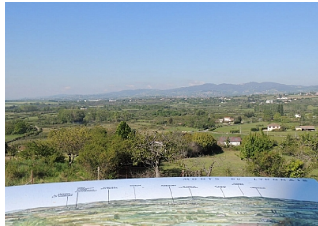
OT Vallée du Garon - C. Comtat