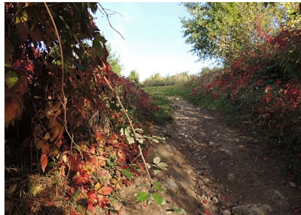
01 Vallée du Garon - E. Brandon