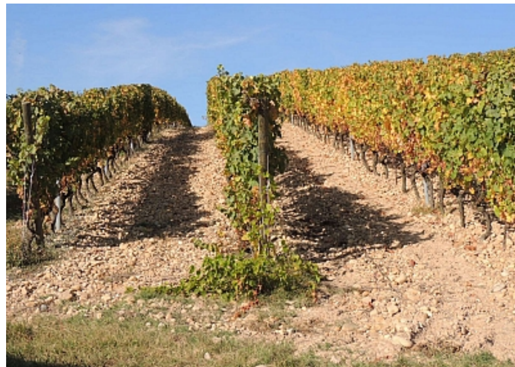
OT Vallée du Garon