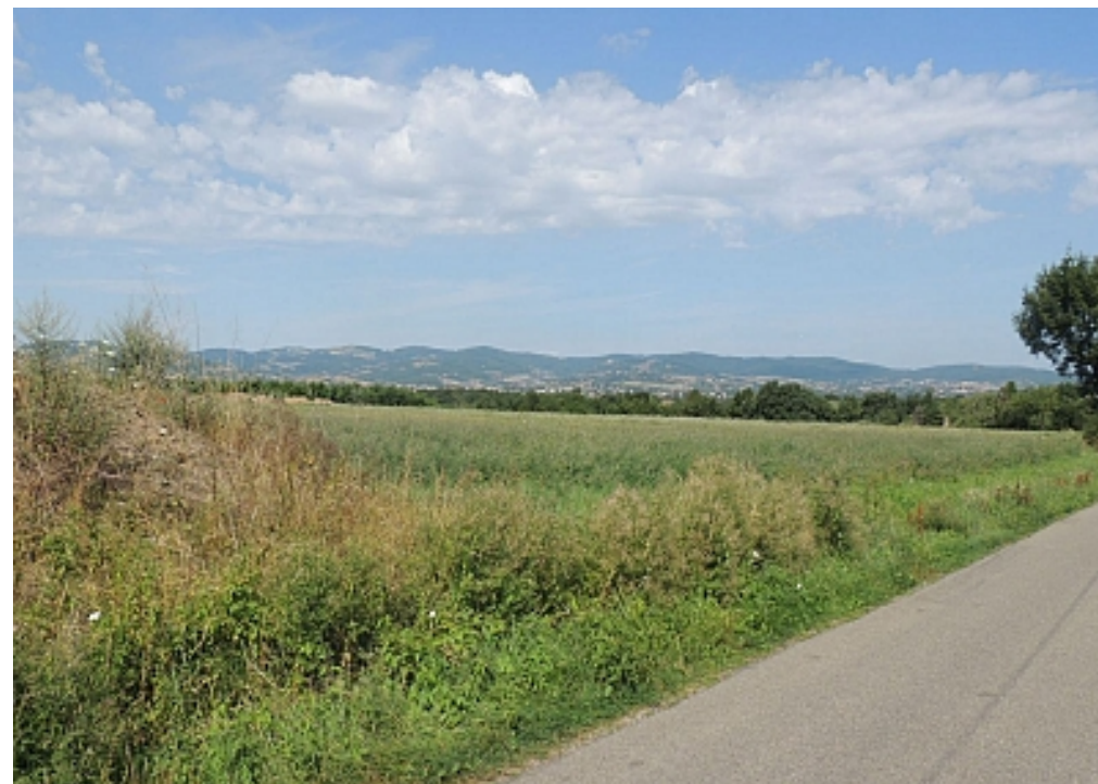
OT Vallée du Garon - E. Brandon