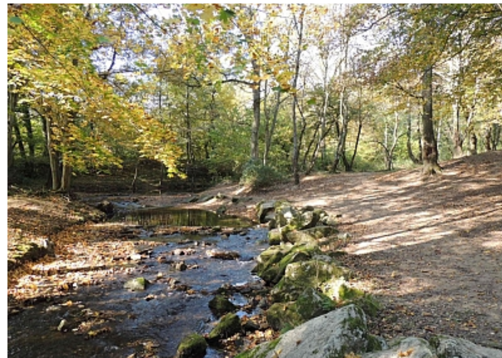
OT Vallée du Garon